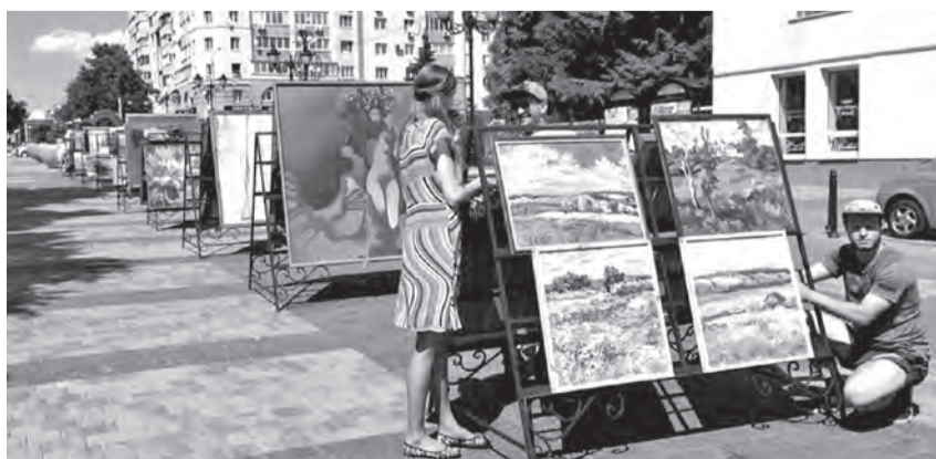
ФОТО ВЫСТАВОЧНОГО ЗАЛА «РОДИНА»

Новый проект под открытым небом стал местом притяжения горожан