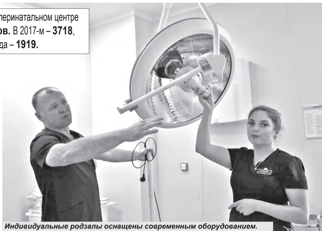
Индивидуальные родзалы оснащены современным оборудованием.

В 2016 году в новом перинатальном центре приняли 1700 родов . В 2017-м – 3718 , за 5 месяцев 2018 года – 1919 .