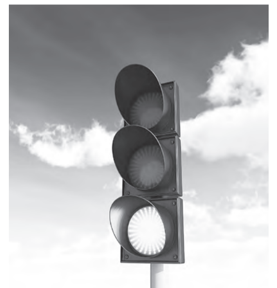
Константин МЫШКИН ФОТО ИЗ СВОБОДНЫХ ИСТОЧНИКОВ

В последнее время в Белгороде появились перекрестки, на которых красный сигнал светофора загорается во всех направлениях, тем самым останавливая движение транспорта. Никита Черненко пояснил: «Такой режим работы светофора введен в соответствии с новым ГОСТом. Сделано это для того, чтобы разделить пешеходные и транспортные потоки для обеспечения безопасности. Пока в Белгороде семь таких перекрестков. Они были отобраны экспертами ГИБДД по показателям аварийности с участием пешеходов. После перевода светофора на новый режим работы подобные ДТП здесь не зафиксированы».