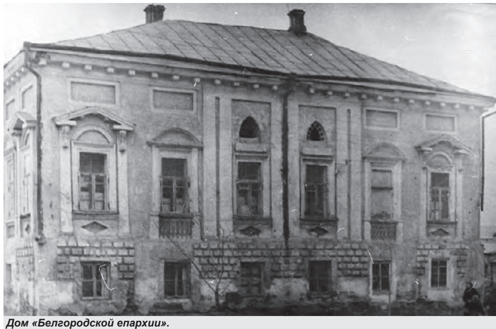
Дом «Белгородской епархии».

Александр ЛИМАРОВ ФОТО ИЗ ЛИЧНОГО АРХИВА АВТОРА