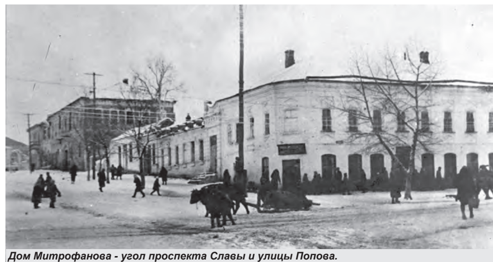
Дом Митрофанова - угол проспекта Славы и улицы Попова.